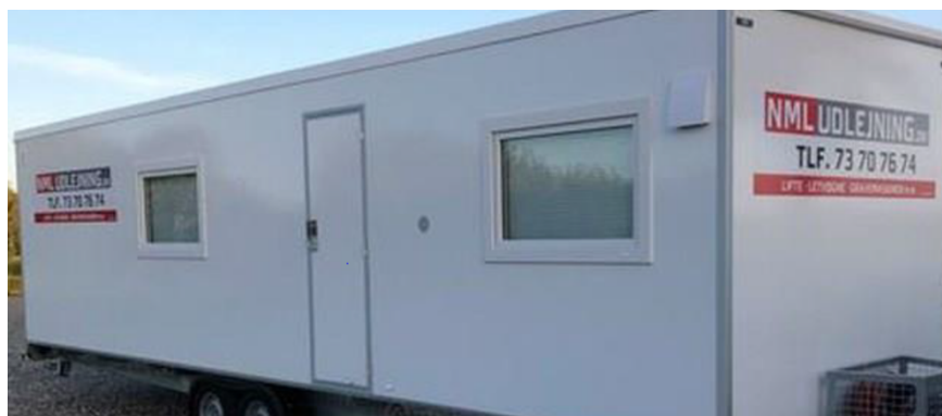
Foto af typen af beboelsesvogne.